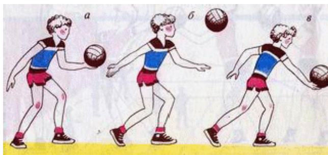
Рисунок 1 – Нижняя прямая передача

и переносит массу тела на левую. После удара выполняется сопровождающее движение руки в направлении подачи, ноги и туловище выпрямляются.